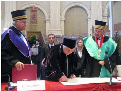
Торжественное подписание Великой Хартии университетов

• По решению экспертного совета международной имиджевой программы «Лидеры XXI века»