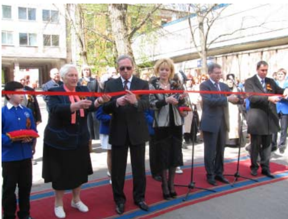
Открытие Аллеи Памяти

• 22–24 апреля в Народной украинской академии проходили Дни Санкт-Петербурга, в рамках которых были проведены мастер-