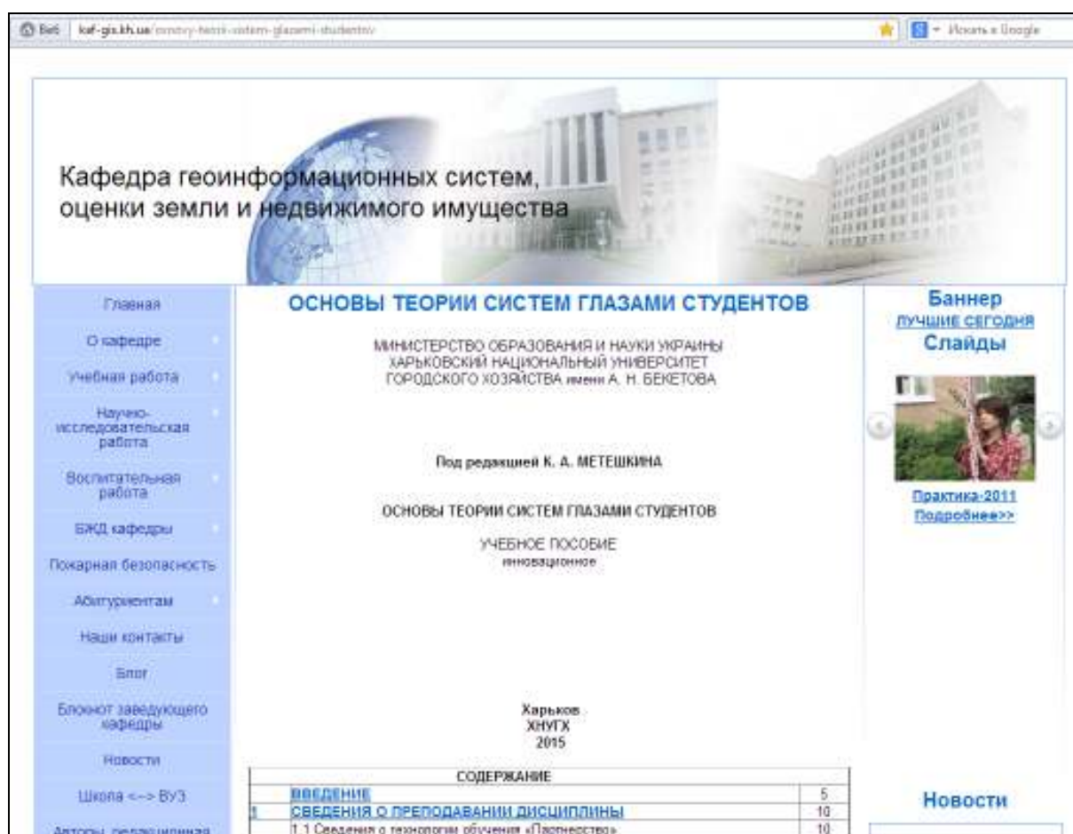
Рис. 1. Фрагмент инновационного учебного пособия

зие сайтов, плюс чаты, форумы, электронная почта, социальные сети и массу всего, что создано для использования сети Интернет. В вузах создаются в виде взаимосвязанных веб-страниц иерархические семантические сети информационных ресурсов. На сегодняшний день существуют официальные веб-сайты вузов, которые содержат веб-страницы факультетов с веб-страницами кафедр. Многие научно-педагогические работники создают персональные веб-сайты, благодаря которым они демонстрируют свою научно-педагогическую деятельность, общаются с представителями научных школ и студенчества и тем самым передают свой опыт и научные достижения, а также получают обратную связь в виде сообщений в блогах и отзывах.