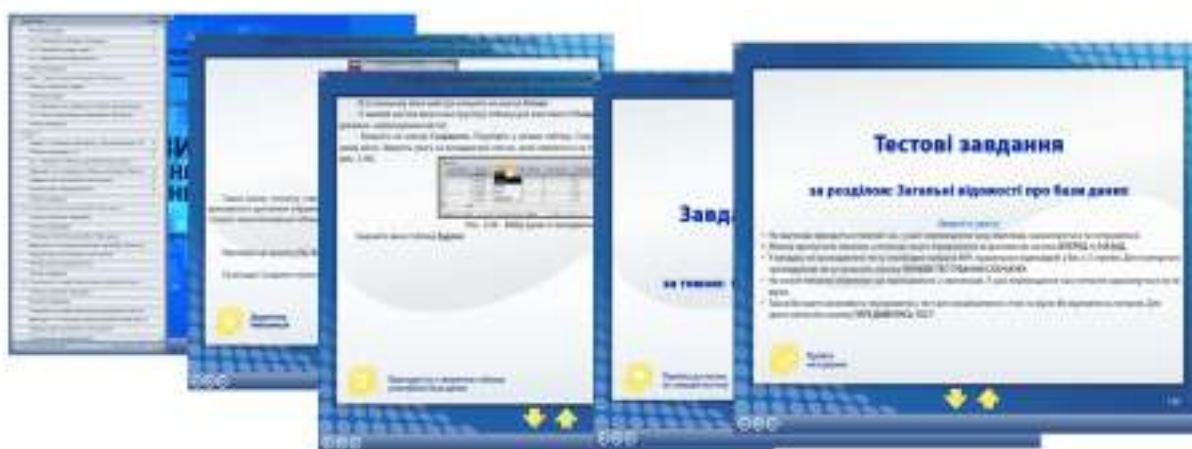
Рис. 1. Слайды ЭУ с примерами адаптивности к требованиям пользователя

В отличие от печатного учебного пособия, ЭУ может содержать материалы нескольких уровней сложности. При этом все они будут размещены на одном носителе, могут содержать иллюстрации, пояснения, видеоуроки, тесты, многовариантные задания для проверки знаний в интерактивном режиме (рис. 1).