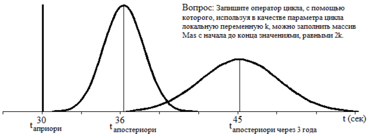
Рис. 2. Результат тестирования (время ответа на вопрос)